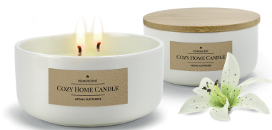
Abbildung ca. 1:1

--- Sicherheitsabstand — Endformat / Stanze — Datenformat